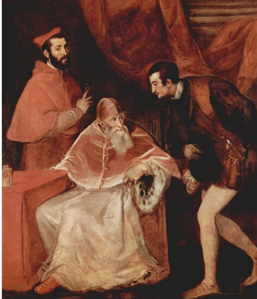
Paul III avec ses neveux

Les portraits de Titien ont l'ambition de révéler le caractère, les intentions des personnes représentées.